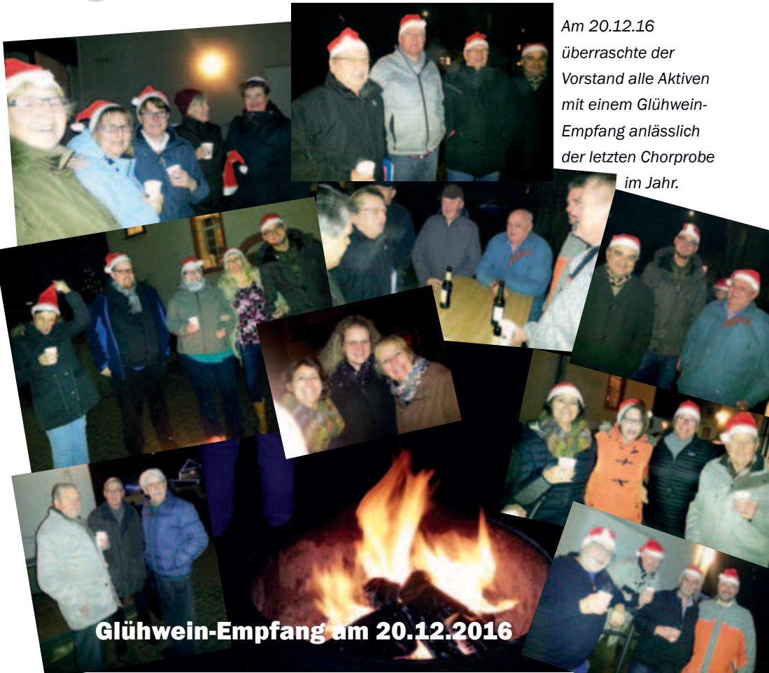
Glühwein-Empfang am 20.12.2016

Am 20.12.16 überraschte der Vorstand alle Aktiven mit einem Glühwein- Empfang anlässlich der letzten Chorprobe im Jahr.