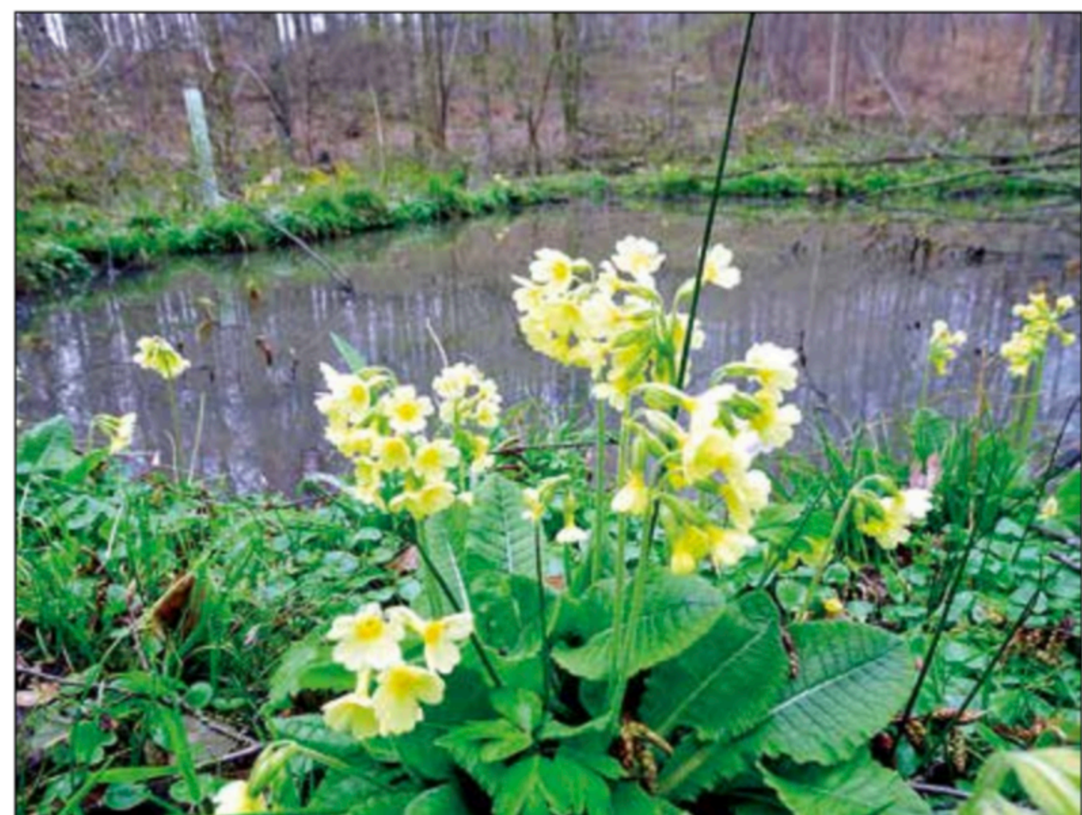
... fotografierte BZ-Leser-Reporter August Weil im Wald von Oppershofen. Die duftende Blume liebt feuchte Wiesen am Bachrand und im Auwald.